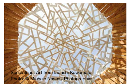
Seeplateau: Art from Tadashi Kawamata.