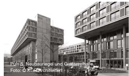
Puls 5, Neubauriegel und Giessereihalle. Foto: © KGP Architekten