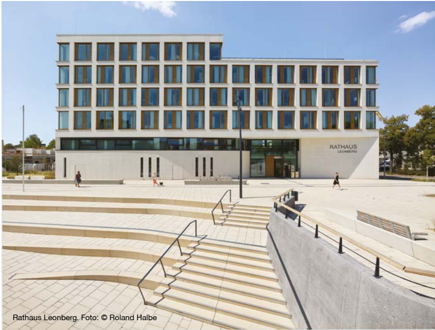
Rathaus Leonberg.