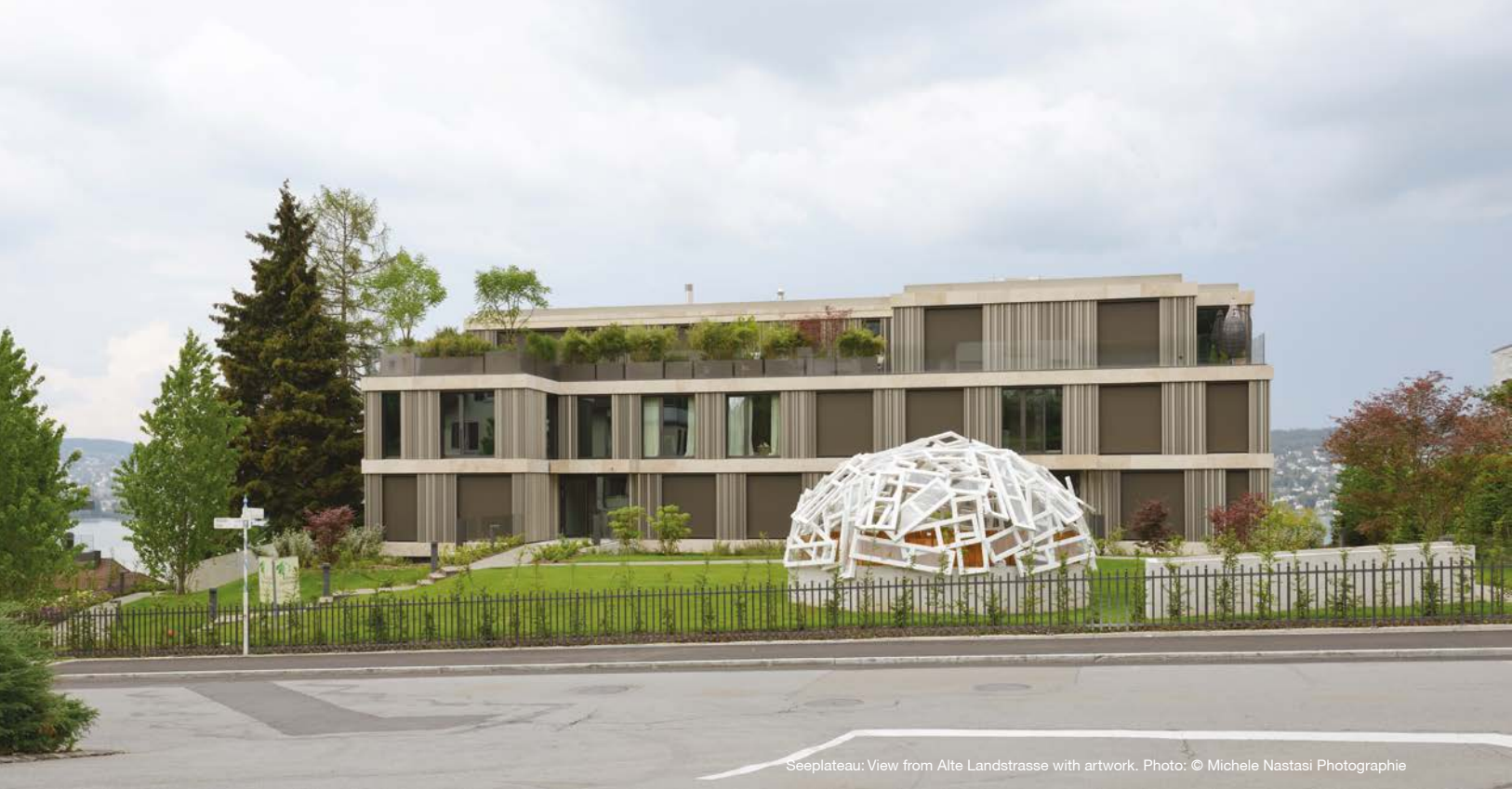
Seeplateau: View from Alte Landstrasse with artwork.