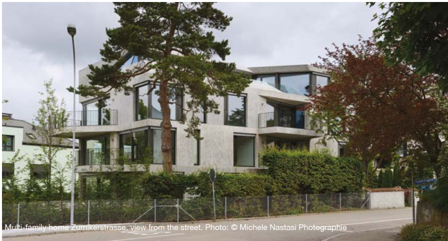
Multi-family home Zumikerstrasse, view from the street.