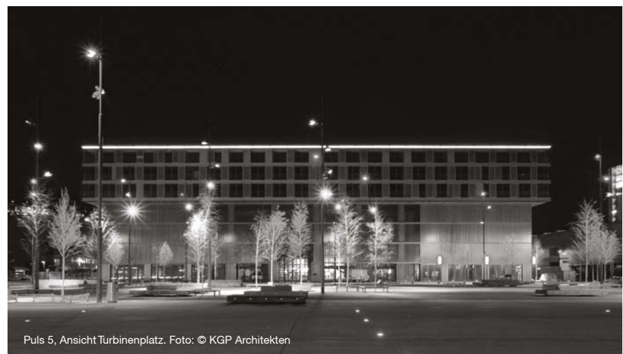
Puls 5, Ansicht Turbinenplatz.