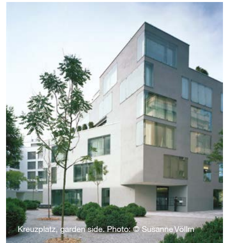
Kreuzplatz, garden side.

Leonberg’s town hall in Germany is another innovative project from KSA Kyncl